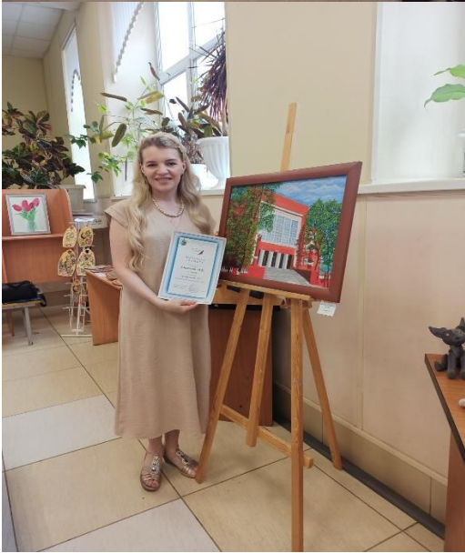
Отчетная выставка студии картину