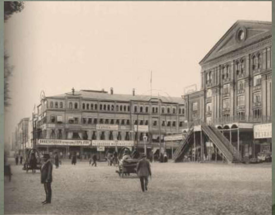
Театральная площадь. Фото М.П.Дмитриева. Конец XIX века. Слева от театра здание гостиницы И.В.Попова «Московское подворье»