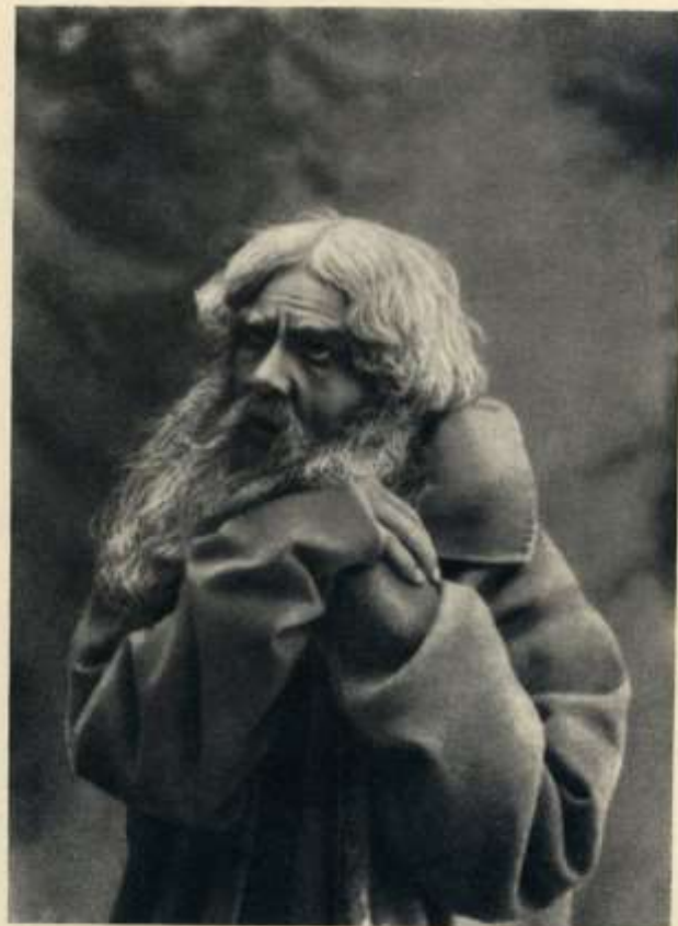
Ф. И. Шаляпин — Сушанин «Иван Сушанин» — опера Глинки Большой театр, Москва, 1901

В сезон 1896 г. решилась и судьба Ф.И.Шаляпина как самобытного оперного певца. Именно здесь он осознает себя артистом, способным развиваться своим особым путем. Остуда от Нижегородского театра можно отсчитывать начало его триумфального успеха на Родине и во всех уголках мира.