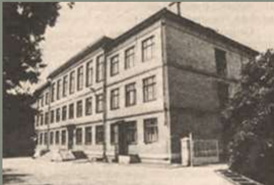
Школа №140 – новая школа имени Ф.М.Шаляпина

Первое здание школы не сохранилось, его перестраивали, расширяли, но сама школа, а главное, ее творческий, неформальный дух остался. В школе № 140 Приокского района Нижнего Новгорода есть музей Шаляпина, ежегодно там проводятся праздники в честь великого певца.