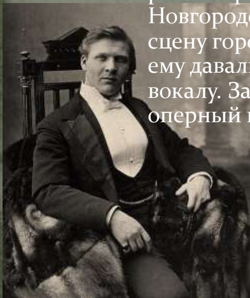
Федор Иванович Шаляпин. 1896 г.