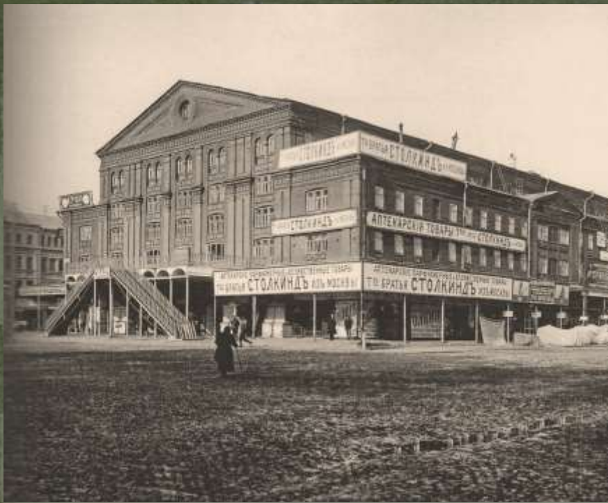
Большой театр на Театральной площади. Арх. Р.Я. Килевейн. 1878 г. Конец XIX века