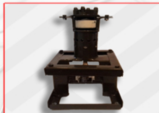
БИНАРНЫЙ ДВИГАТЕЛЬ ВНУТРЕННЕГО СГОРАНИЯ.