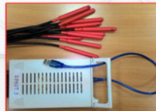
МНОГОКАНАЛЬНАЯ СИСТЕМА РЕГИСТРАЦИИ И ХРАНЕНИЯ ДАННЫХ О ТЕМПЕРАТУРЕ СРЕДЫ.