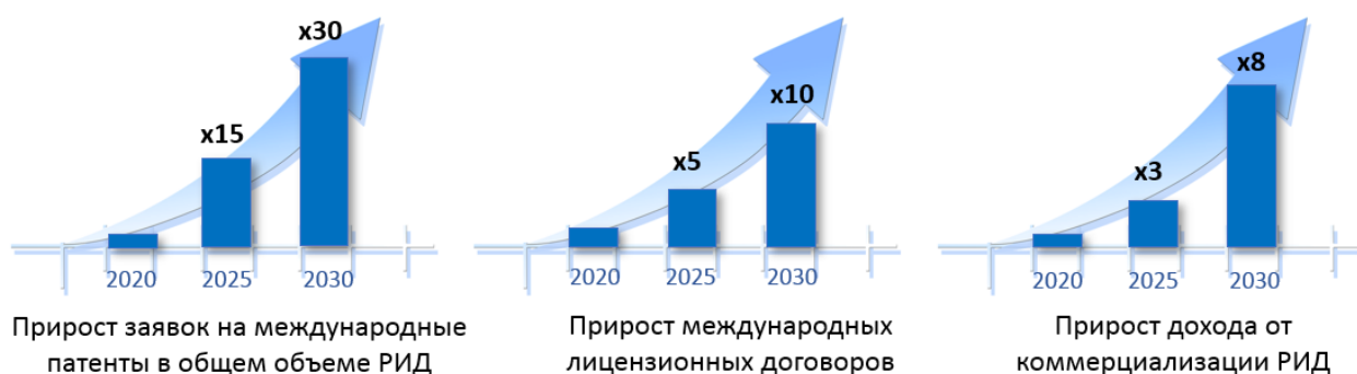
Рис. 3. Динамика роста показателей патентной стратегии

Политика в области инноваций и коммерциализации разработок в своей основе направлена на внедрение результатов НИОКТР в реальный сектор экономики. С этой целью меняется патентная стратегия НГТУ, в соответствии с которой университет расширит свое влияние в международном «патентном пространстве». Планируется существенное увеличение количества заявок, поданных в международные патентные ведомства (Евразийские, Европейские и Американские), а также прирост международных лицензионных договоров и дохода от коммерциализации РИД (рисунок 3).