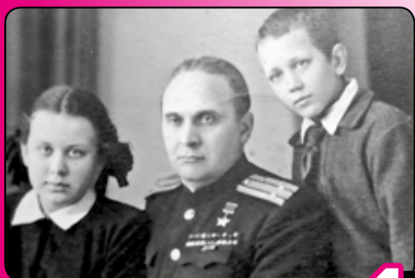
Дочь вспоминает отца