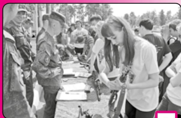
Военно-патриотическая игра «Звезда»