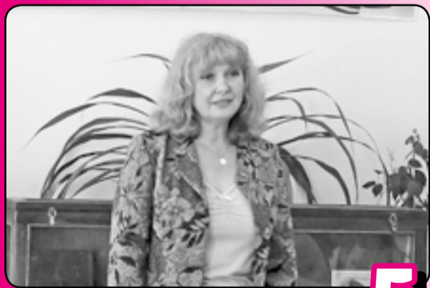
«Исторической памятью души ОЧИСТИ...»