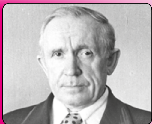
К 100-летию Б. П. Платонова