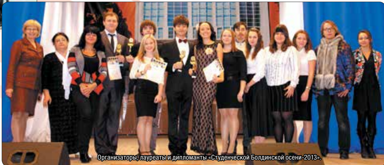
Организаторы, лауреаты и дипломанты «Студенческой Болдинской осени-2013».