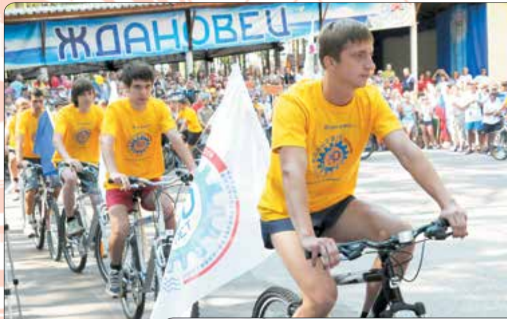
Летом в «Ждановце».