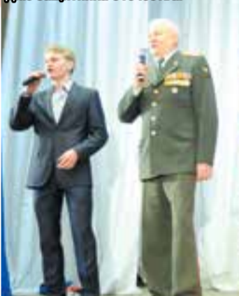
Торжественное собрание, посвященное Дню защитника Отечества.