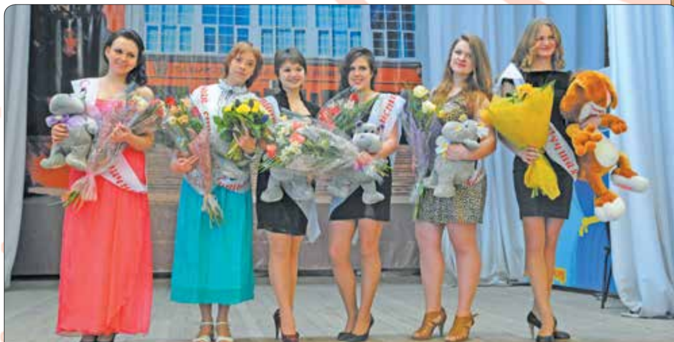
Конкурс Татьяна в День российского студенчества.

НГТУ имени Р. Е. Алексеева – это цех, в котором сотни преподавателей трудятся над созданием профессиональных изобретателей и талантливых инженеров. Лекции, семинары, конференции, конкурсы, акции, соревнования – всё это события, которые наполняют и разнообразят учебный год студентов.