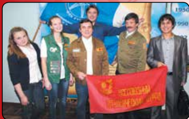
Решение о создании Штаба студенческих отрядов в политехе было принято на встрече ветеранов ССО и молодежи. Штаб создан.