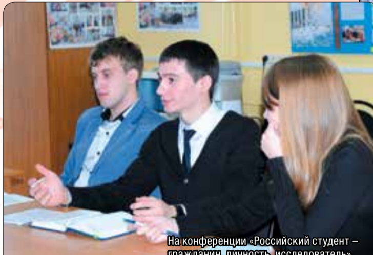
На конференции «Российский студент – гражданин, личность, исследователь».

сти, посвященных 400-летию дома Романовых, 110-летию начала русско-японской войны, и др. В декабре 2013 года совместно с библиотекой был проведен круглый стол «Конституционные традиции в России и в мире» с участием членов избирательной комиссии Нижегородской области. К этому мероприятию студенты подготовили презентацию, фотовыставку, газету, плакаты.