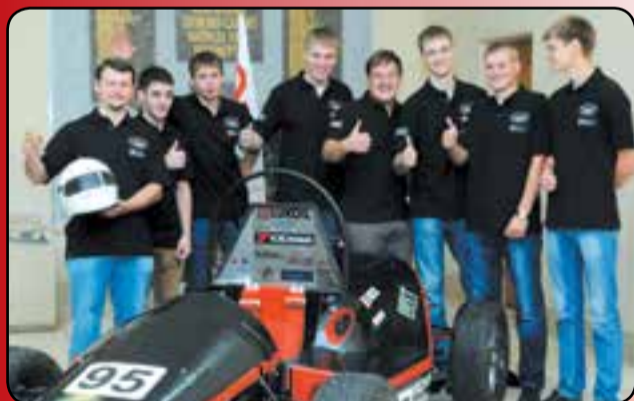
Команда Студенческого КБ Formula Student к отъезду на чемпионат мира в Италию готова.