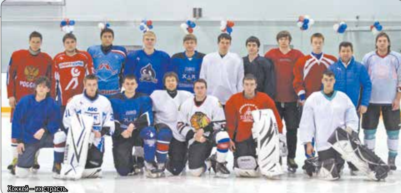
Хоккей – их страсть.

О том, насколько всё это интересно и полезно, лучше всех расскажут непосредственные участники вузовских мероприятий.