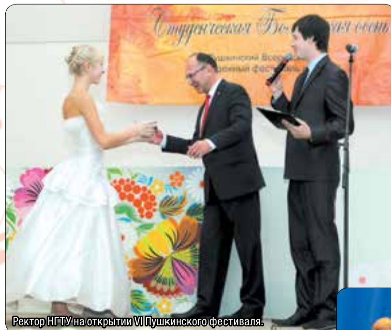
Ректор НГТУ на открытии VI Пушкинского фестиваля.

Сейчас уже никто и не сомневается в том, нужен ли Пушкинский фестиваль искусств в техническом университете. Ибо фестиваль «Студенческая Болдинская осень» есть. Он живет, развивается и прошлой осенью в шестой раз состоялся в НГТУ имени Р. Е. Алексеева.