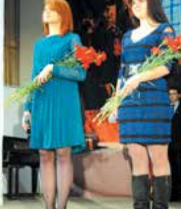
Группа 12-УП ФЭМИ – «Лучшая группа НГТУ-2013»