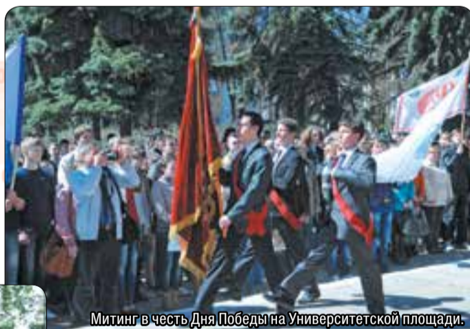
Митинг в честь Дня Победы на Университетской площади.

В настоящее время уже невозможно представить политех без таких проектов, как «Мистер НГТУ» и «Мисс НГТУ». Первичная организация Российского союза молодежи университета, напри-