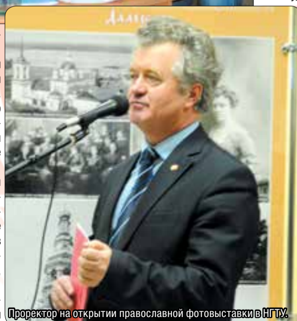
Проректор на открытии православной фотовыставки в НГТУ.