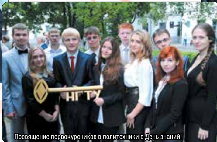
Посвящение первокурсников в политехники в День знаний.

курсам и фестивалям. Студенты посещают школы актива, принимают участие в конференциях «Российский студент – гражданин, личность, исследователь» и «Будущее технической науки», в майском атлетическом пробеге, отдыхают в знаменитом (опять же своими интересными традициями) спортивно-оздоровительном лагере «Ждановец».