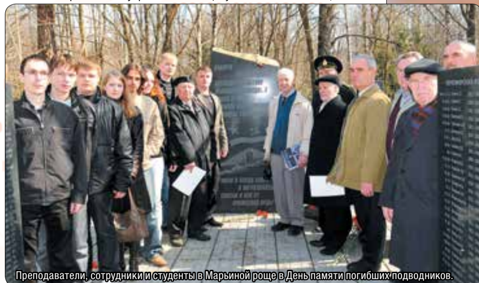
Преподаватели, сотрудники и студенты в Марьиной роще в День памяти погибших подводников.