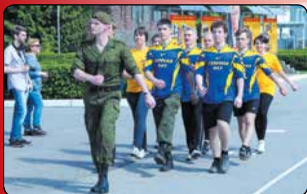
Смотр строя и песни. На марше команда ФАЭ – победительница военно-спортивной игры НГТУ «Зарница-2013» в Шумиловской бригаде.