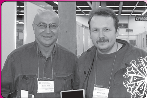
Зарождение новой научной школы в политехе