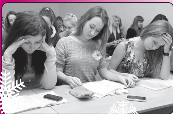
Скоро сессия! Советы психолога