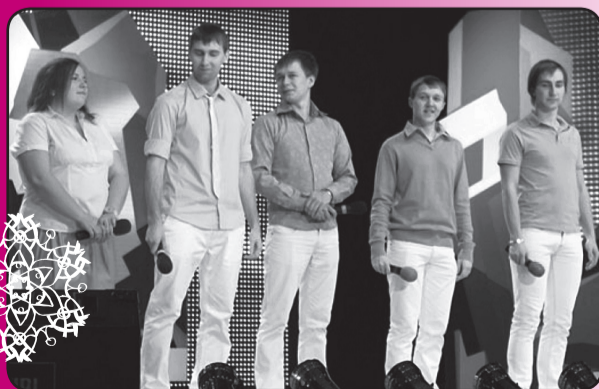
Команда КВН «Скандалы» –