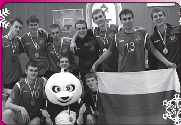
«Золотая пятерка» НГТУ