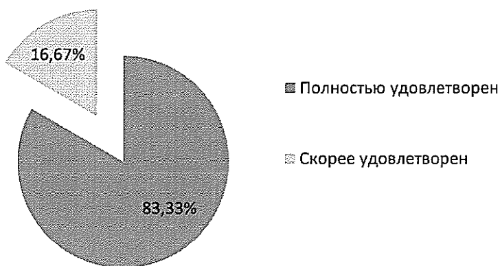
Рисунок 1 - Удовлетворенность получения высшего образования в НГТУ

По результатам проведенного анкетирования было выявлено, что все обучающиеся удовлетворены получением образования в НГТУ.